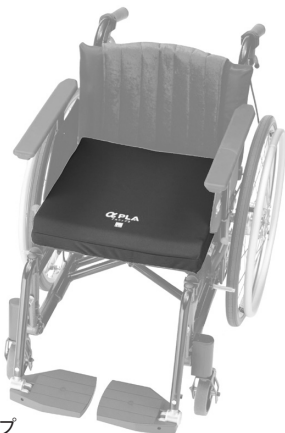
撥水・防水カバータイプ