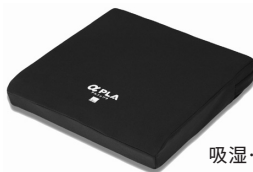
吸湿・速乾カバータイプ